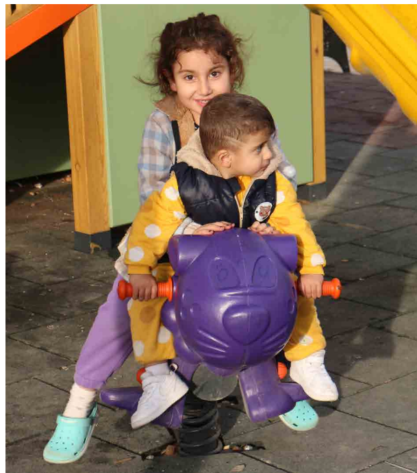
Dans la ville d'Adiyaman, les enfants profitent du parc d'activités construit par l'association FISA.

Dans la ville d'Adiyaman, où 80 % des 600 000 habitants ont été impactés par le séisme, l'association FISA assure une prise en charge psychologique et éducative des enfants. Des séances de thérapie parents / enfants encadrées par des psychologues ainsi que des ateliers éducatifs et créatifs (dessin, chant, danse, ...) sont proposés tous les jours dans le local de l'association. FISA s'engage aussi contre le travail infantile qui s'est particulièrement développé après le séisme, en menant des actions d'accompagnement juridique avec une équipe d'experts dédiée. Grâce au soutien de la Fondation de France, un parc d'activités en plein air à proximité de trois centres scolaires a été construit, offrant aux enfants un lieu sécurisé de jeux et de sociabilité.