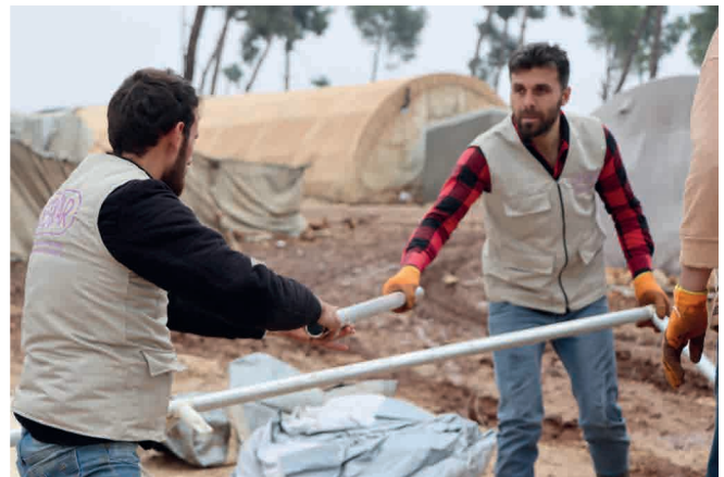
Dans la ville d'Afrin, une ONG* syrienne installe des tentes dans les camps de réfugiés.