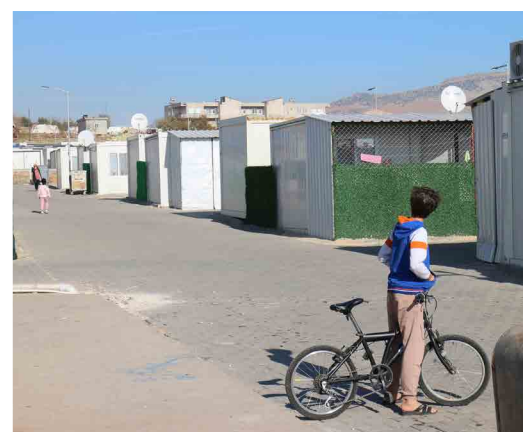
L'association Shuder a construit à Adiyaman un village composé de 1 200 containers qui accueille plus de 7 000 habitants.

Yosr Dallegi, chargée de programme Urgences à la Fondation de France