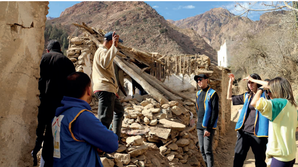
Les équipes de la Fondation Amane et de la Fondation de France, dans les villages détruits par le séisme.