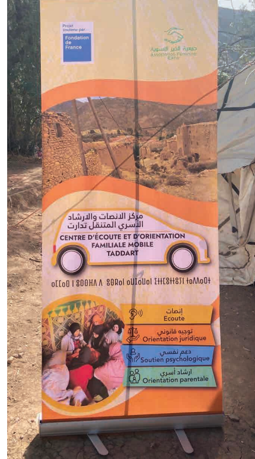
Affiche du centre d'écoute mobile déployé par l'association Elkhir.

À Marrakech, l' ALCS (association de lutte contre le sida) accompagne plus de 600 personnes vulnérables : sur le plan matériel (distribution de colis et bons alimentaires, kits d'hygiène...) mais aussi psychologique (soutien psychosocial et suivi post-traumatique) et médical (prise en charge de consultations et traitements).