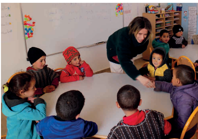
Dans le village de Titane, dans les montagnes de Taroudant, l'association Tibu a réhabilité l'école partiellement détruite par le séisme.

Durant les premières semaines qui ont suivi le séisme, la Fondation de France a déployé des aides d'urgence pour assurer la mise à l'abri des populations sinistrées grâce à des tentes, des containers ou des chapiteaux. La Fondation de France soutient par exemple l'ONG Jood , très impliquée sur la question du relogement, qui installé 30 maisons préfabriquées et 30 blocs sanitaires, avec douches, lavabos et toilettes, dans les villages de Moulay Brahim, Talat N'Yaaqoub, Imgdal et Ljoukak. De son côté, l'association Nissae Souss accueille les femmes et leurs enfants dans son centre d'hébergement, et leur fournit des vêtements, repas, produits d'hygiène, médicaments, fournitures scolaires ainsi qu'un soutien psychologique.