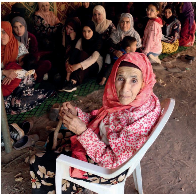
L'association Elkhir accompagne les femmes du village de Taddart, au cœur du Moyen Atlas, touchées par le séisme.