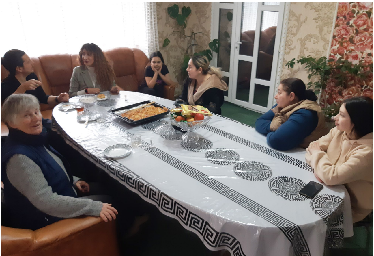
En Moldavie, la Roma Awareness Foundation pourvoit aux besoins de première nécessité - hébergement, alimentation... - de réfugiés roms venus d'Ukraine.

En Roumanie, l'association Concordia , spécialisée dans l'aide sociale à l'enfance, apporte un soutien complet aux familles de réfugiés ukrainiens, de l'hébergement transitoire au soutien psychologique et administratif. Elle organise également des activités ludiques et éducatives à l'attention des plus jeunes, qui leur permettent de mettre à distance les traumatismes de la guerre. Ces six derniers mois, ce sont ainsi plus de 700 personnes, en majorité des femmes et des enfants, qui ont été accompagnées.