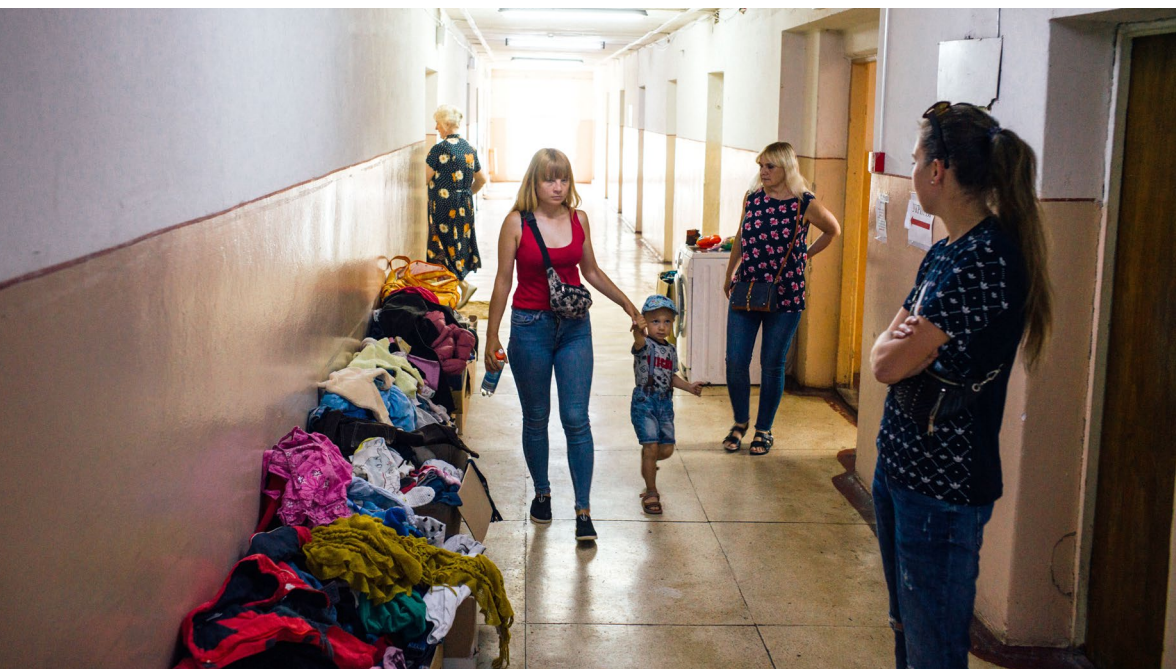
A l'université d'Uzghorod, où la Carpathian Foundation accueille des personnes déplacées, des femmes et des enfants en particulier.