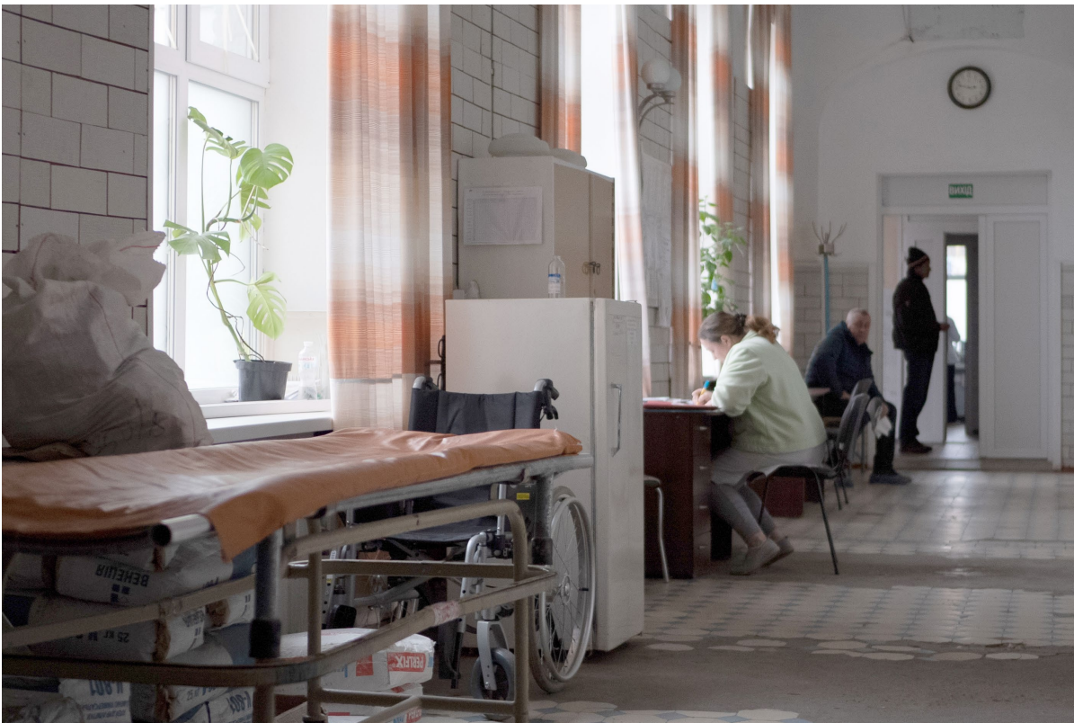
L'association CAM-Z fournit des générateurs aux hôpitaux, indispensables lors des coupures d'électricité.

Parce qu'il faut héberger, nourrir mais aussi éclairer et chauffer – surtout en hiver –, la Fondation de France soutient plusieurs initiatives pour équiper en groupes électrogènes des centres d'accueil, des hôpitaux. Électriciens sans frontières et l'association CAM-Z fournissent ainsi des générateurs à des établissements collectifs, notamment des hôpitaux où les coupures d'électricité menacent la vie des patients en réanimation. L'organisation Angel of Salvation , quant à elle, équipe en chauffages les centres d'hébergement de réfugiés en provenance de la ligne de front ou des zones occupées.